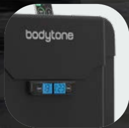
Cubiertas de termoplástico de alta calidad