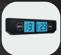
Contador de repeticiones