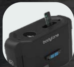
Sujección para botellas y móviles