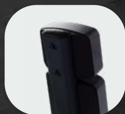
Cubiertas en ABS inyectado