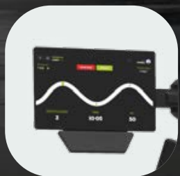
Pack de conectividad con pantalla de 9" y NFC (opcional)

Nuestra línea premium de equipamiento de fuerza con una mejor precisión en los ejercicios y calidad superior. Descubre todas las novedades >>>