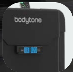
Cubiertas de termoplástico de alta calidad