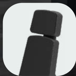
Acabados en fibra de carbono