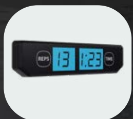
Contador de repeticiones