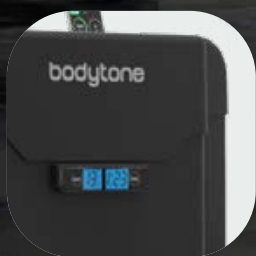
Cubiertas de termoplástico de alta calidad