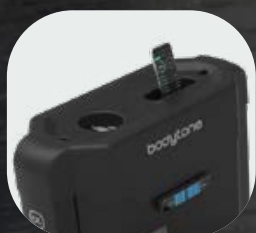
Sujección para botellas y móviles