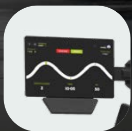
Pack de conectividad con pantalla de 9" y NFC (opcional)

Nuestra línea premium de equipamiento de fuerza con una mejor precisión en los ejercicios y calidad superior. Descubre todas las novedades >>>