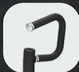
Empuñaduras antideslizantes de PVC