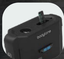
Sujeción para botellas y móviles