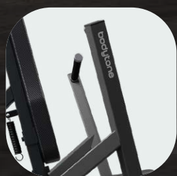
Movimiento independiente convergente