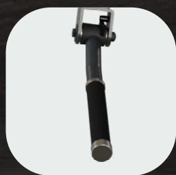
Empuñaduras antideslizantes con funda de PVC