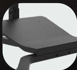
Plataformas y reposapiés antideslizantes