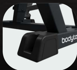
Topes de goma en las bases