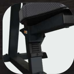
Asientos regulables en distintas alturas