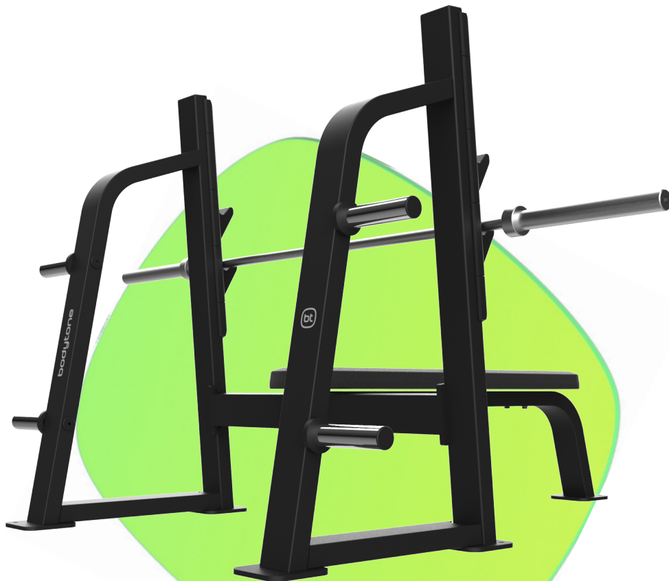
FBC08 PRESS PLANO OLÍMPICO

Estudio de biomecánica y ergonomía bajo la supervisión de profesionales y atletas asociados. Tras un largo período de diseño; desde el boceto, investigación en ingeniería, producción de prototipos, test por parte de atletas profesionales nuestros productos salen al mercado.