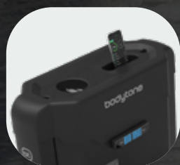
Support pour bouteilles et mobiles