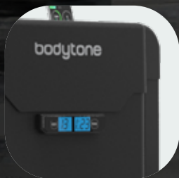
Couvertures thermoplastiques de haute qualité