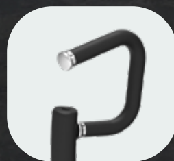
Poignées antidérapantes en PVC