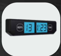
Compteur de répétitions