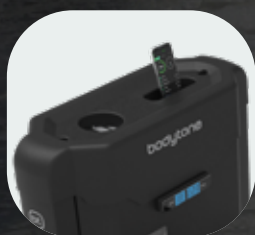
Support pour bouteilles et mobiles