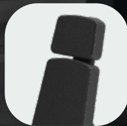
Finitions en fibres carbone