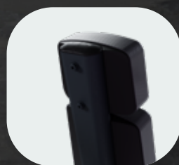
Recouvert de ABS injecté