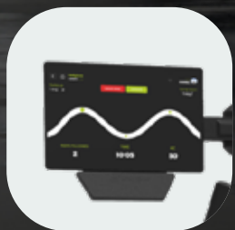
Pack connectivité avec écran 10" et NFC (en option)

Notre gamme d'équipements de musculation haut de gamme avec une meilleure précision d'exercice et une qualité supérieure. Découvrez toutes les actualités >>>