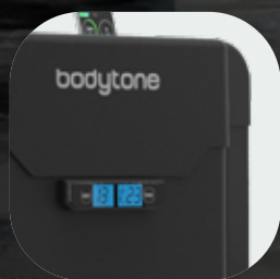
Couvertures thermoplastiques de haute qualité