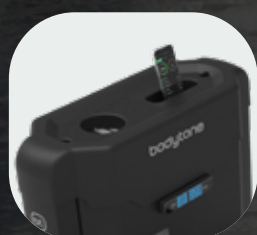
Support pour bouteilles et mobiles