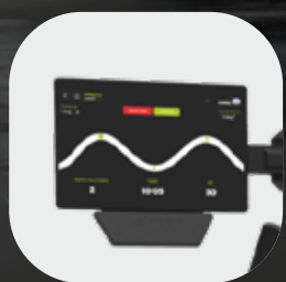
Pack connectivité avec écran 10" et NFC (en option)

Notre gamme d'équipements de musculation haut de gamme avec une meilleure précision d'exercice et une qualité supérieure. Découvrez toutes les actualités >>>