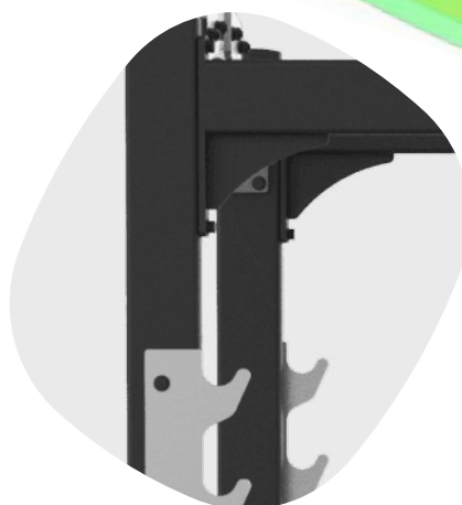
STRUCTURE EN ACIER ROBUSTE ET FERME