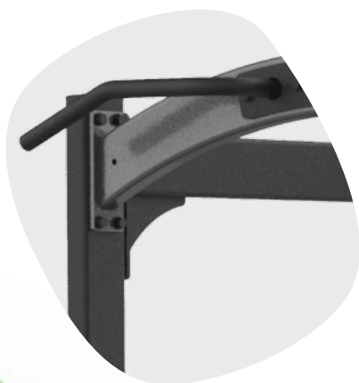
POIGNEE DE TRACTION MOLETEE